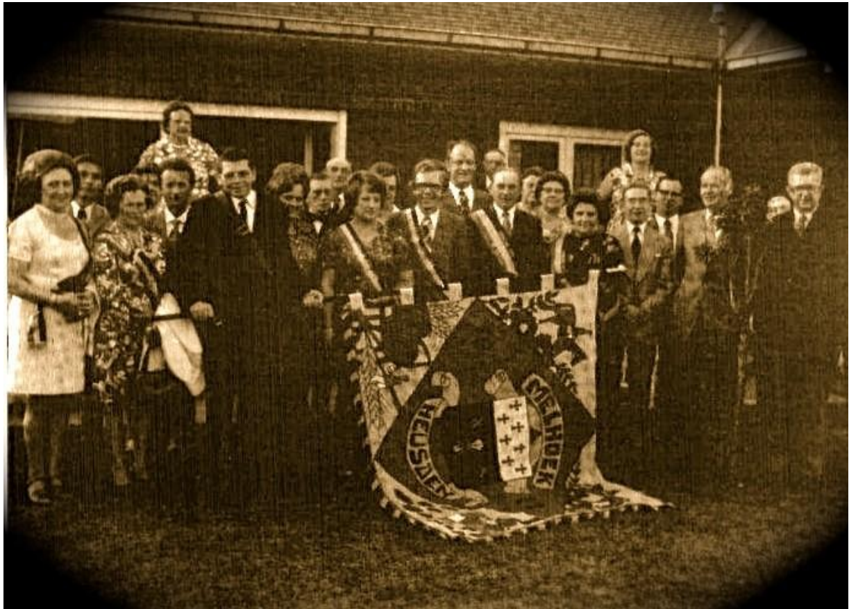
Inhuldiging van de vlag

In de zomer van 1972 was er weer feest in " Den Melhoek ", want we hadden een officiële vlag!